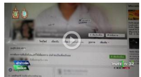
ล้วงสอบครูตบททุ - ต่อยอกเด็ก ม.5