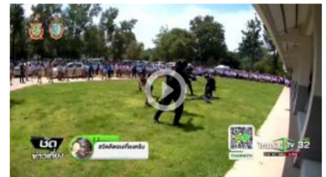
คอมมานโดมอบความสุขเด็กหัวไกล