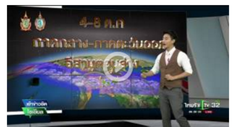
รู้ก่อนร้อนหนาว 4 ต.ค. 59