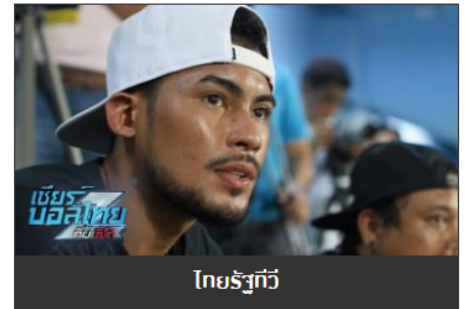
คลิปข่าวที่น่าสนใจ